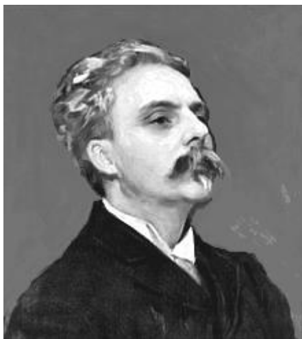
Gabriel Fauré peint par John Singer Sargent vers 1889